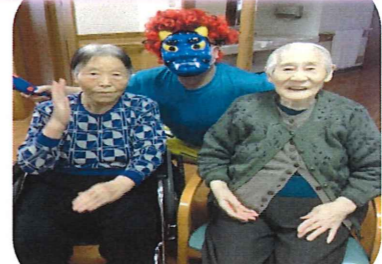
2月 鬼さんと、はいチーズ!