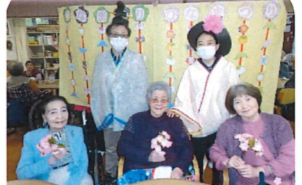
3月 お雛様勢ぞろい。