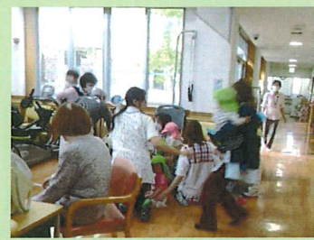
老健、保育園の避難の様子