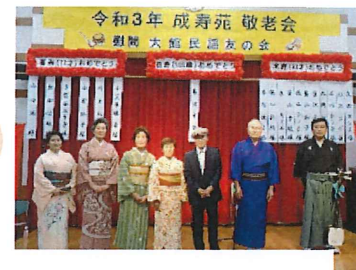
大館民謡友の会の皆様

釈迦内保育園とキッズテラスアットセイジユの園児からは、お祝いのDVD メッセージや色紙が届きました！