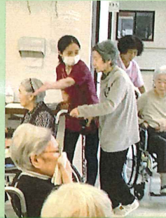
Club city の避難の様子

9月は防災月間ということで、9月9日午前中はClub Cityで火災想定訓練、午後から成寿苑ユニットと通所、保育園合同で地震想定避難訓練を行いました。また、訓練終了後には実際に消火器を使用して消火訓練をしました。