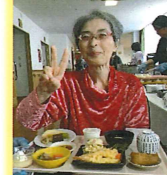
クリスマスバイキング・クリスマス会