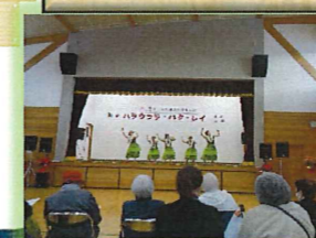
ハラウ・フラ・ホクレイ 発表会観賞