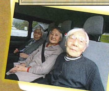
いやあ〜、お天気も良く いい眺めだったなあ😊