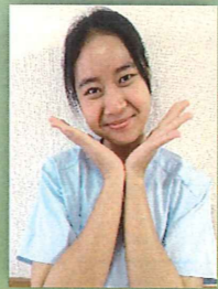
カイン カイン チョー