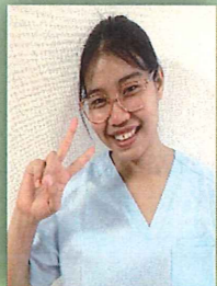
サン ター ヌエ