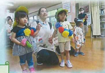
花笠かぶってにっこり笑顔