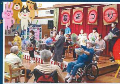
通所は利用者様と職員と一緒に「お嫁サンバ」を踊りました。