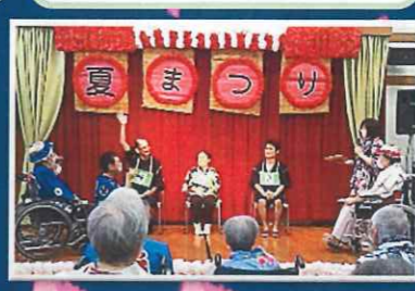
B ユニットはロシアンシュークリーム。