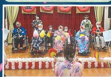
C ユニットは北島三郎の「まつり」に合わせてみんなで踊りました。