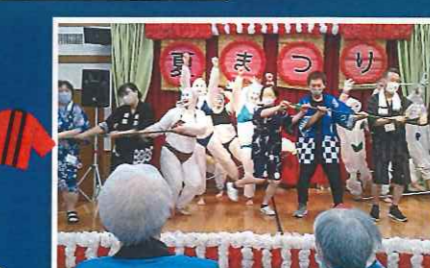
「アンコール！」の掛け声とともに再びステージへ!