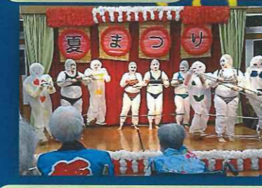
看護部・介護部による棒人形ダンス。大いに会場を盛り上げてくれました。