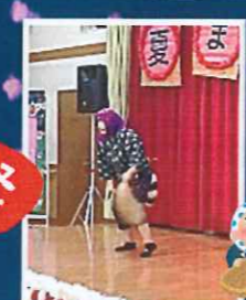
毎年恒例のどじょうすくい。今年も大好評でした。