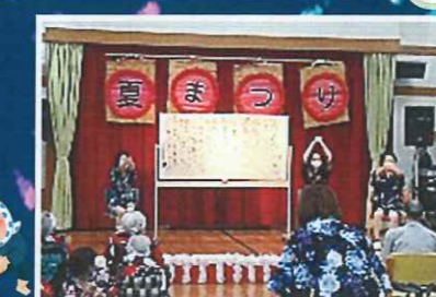
リハビリ部による脳トレ体操。皆で頭と体を動かしてスッキリ。