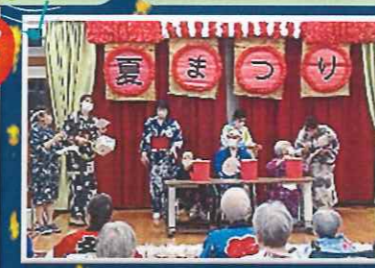
A ユニットは恒例のクイズ。お目当てのお宝はどこに入っているでしょうか?