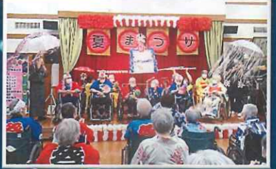
Dユニット利用者様と職員で「お祭りマンボ」に合わせて踊りました。