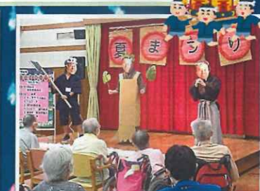
相談部・事務部「与作」の曲に合わせてサブちゃん登場!?